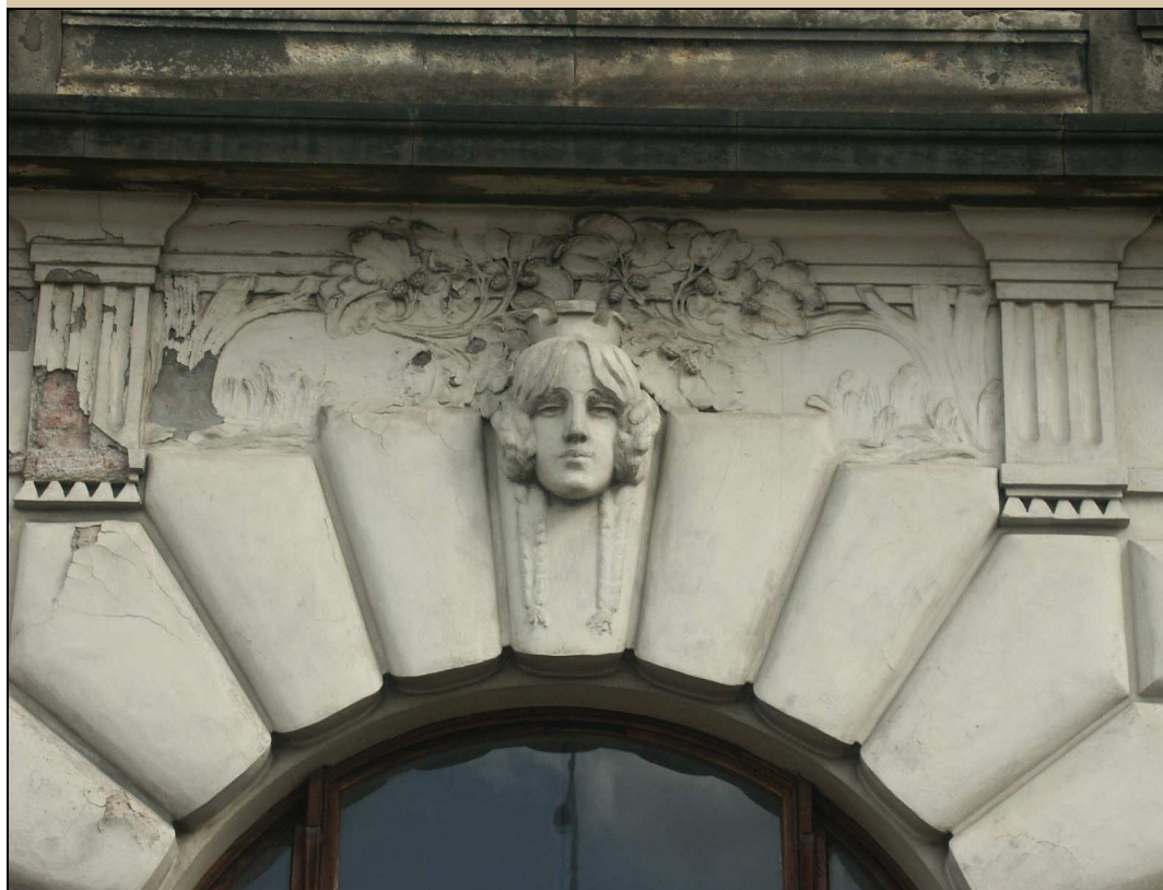
maskaron v klenáku okna stav z roku 2004