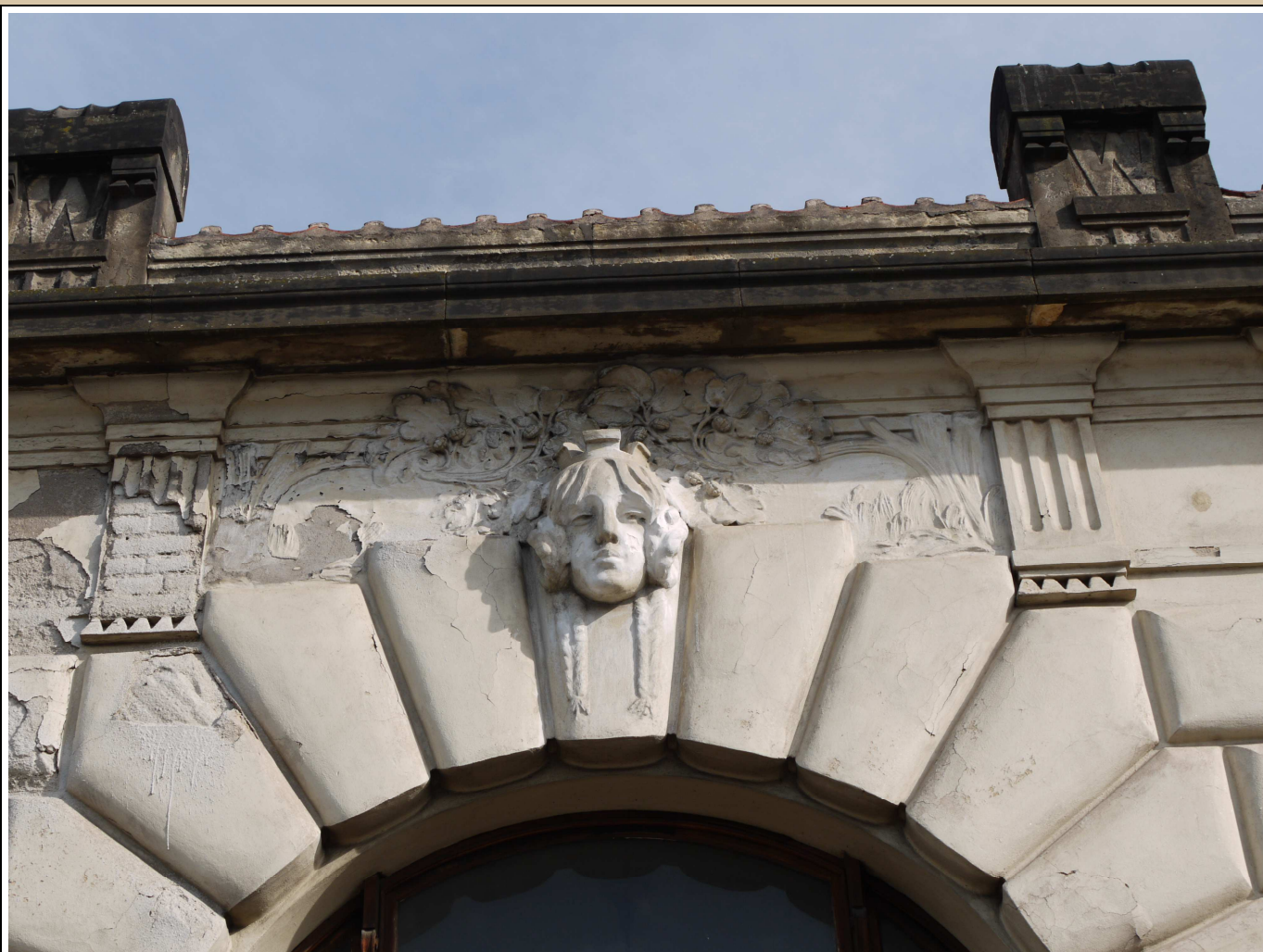
maskaron v klenáku okna stav z roku 2017